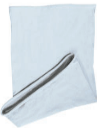
88683.31 S - 2 025 ks