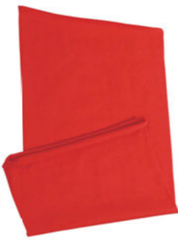
88683.50 S - 720 ks