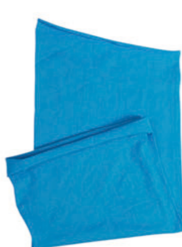
88683.39 S - 3 591 ks