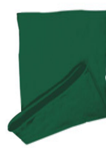
88683.43 S - 2 114 ks