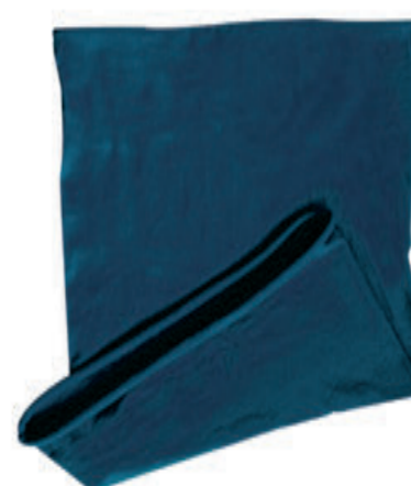
88683.14 S - 4 654 ks