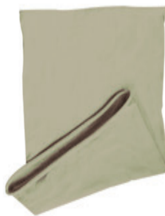
88683.38 S - 3 839 ks