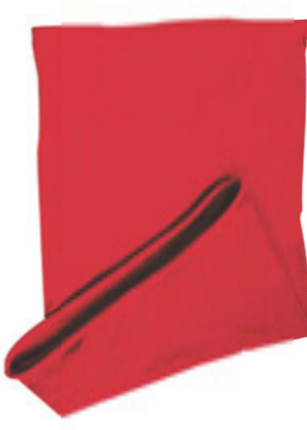
88683.16 S - 997 ks