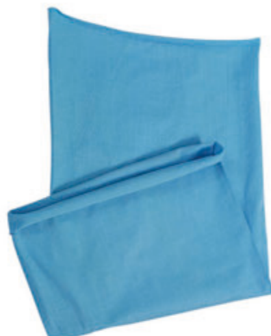
88683.07 S - 246 ks