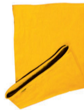
88683.44 S - 1 776 ks