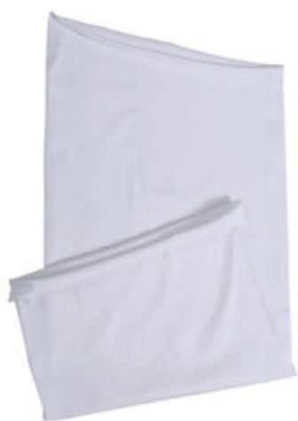
88683.54 S - 1 835 ks