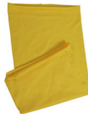
88683.20 S - 5 198 ks