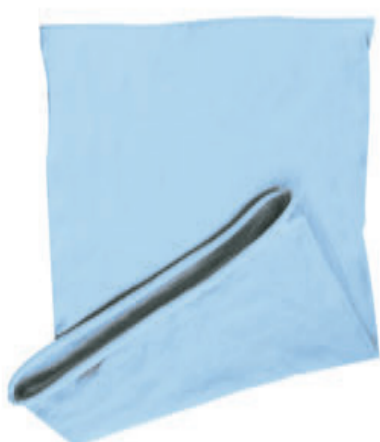
88683.51 S - 11 579 ks