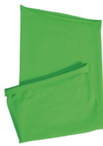
88683.48 S - 9 115 ks