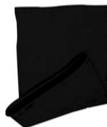
88683.08 S - 6 672 ks

Multifunkčná čelenka Myrtle Beach s 13 možnosťami nosenia. Čelenka je vyrobená z 95% bavlny (česaná bavlna) a 5% elastanu. Veľmi elastická pletenina, váha: 145 g / m 2 , veľkosť: 25 x 50 cm