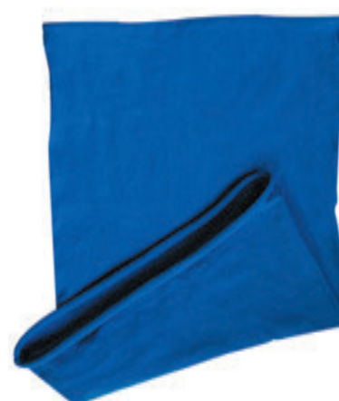
88683.28 S - 4 877 ks