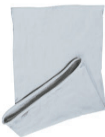
88683.06 S - 1 147 ks