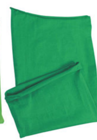
88683.26 S - 838 ks