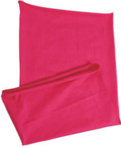
88683.01 S - 1 814 ks