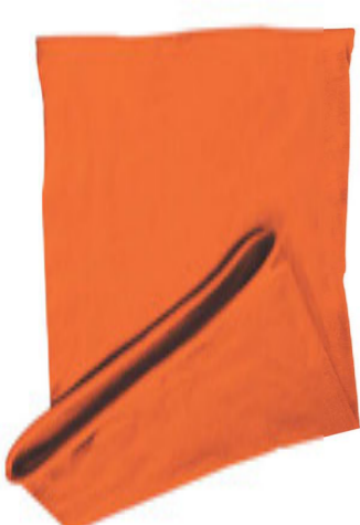
88683.17 S - 4 011 ks